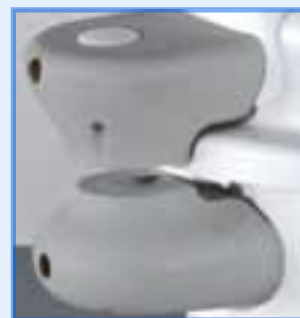
Mecanismo de fecho de segurança

A autoclave Classic Media tem mecanismos de segurança integrados que previne a unidade de ser aberta até a temperatura interior diminuir para valores seguros. Esta característica é muito importante uma vez que noutros equipamentos ocorrem muitos perigos após a esterilização.